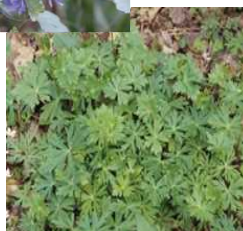
トリカブトの芽生え