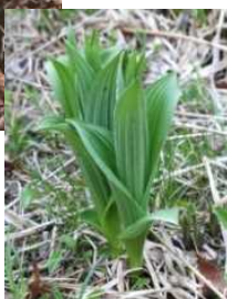
芽出し期のコバイケイソウ