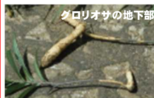
グロリオサの地下部